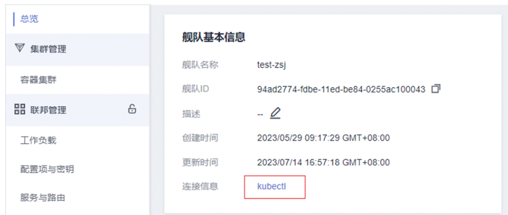
图 4-1 kubectl 连接信息

步骤2 参照页面中的提示信息，选择对应的项目名称、虚拟私有云(VPC)、控制节点子网以及有效期，单击“下载”，下载kubectl配置文件。