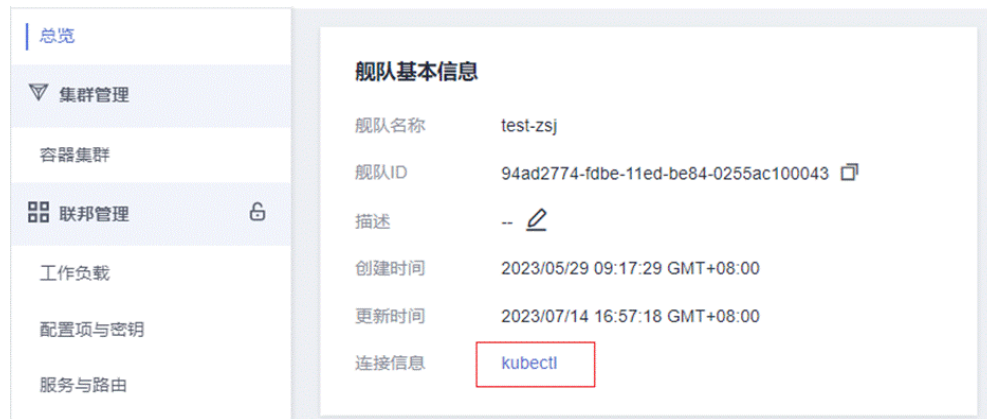
图 4-1 kubectl 连接信息

步骤2 参照页面中的提示信息，选择对应的项目名称、虚拟私有云(VPC)、控制节点子网以及有效期，单击“下载”，下载kubectl配置文件。