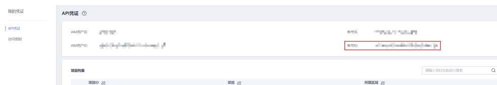
图 5-2 获取账号 ID