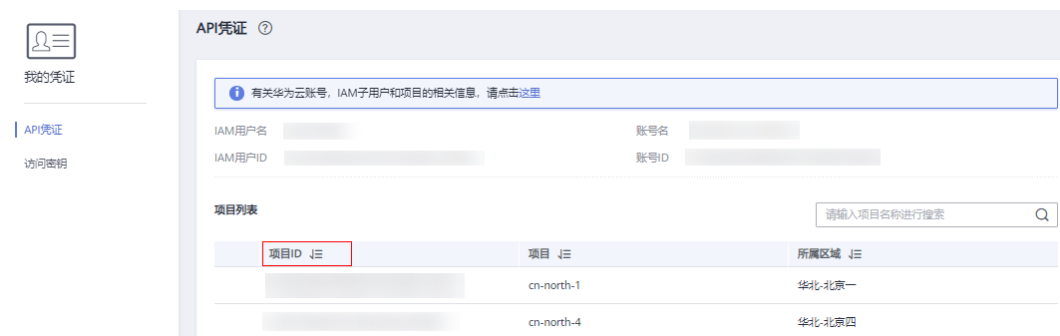
图 5-1 查看项目 ID