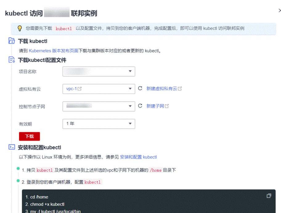
图 4-2 kubectl 连接联邦实例